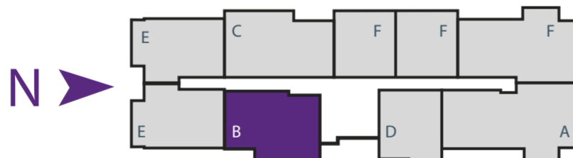
Piso 1, 2, 3, 4 y 5