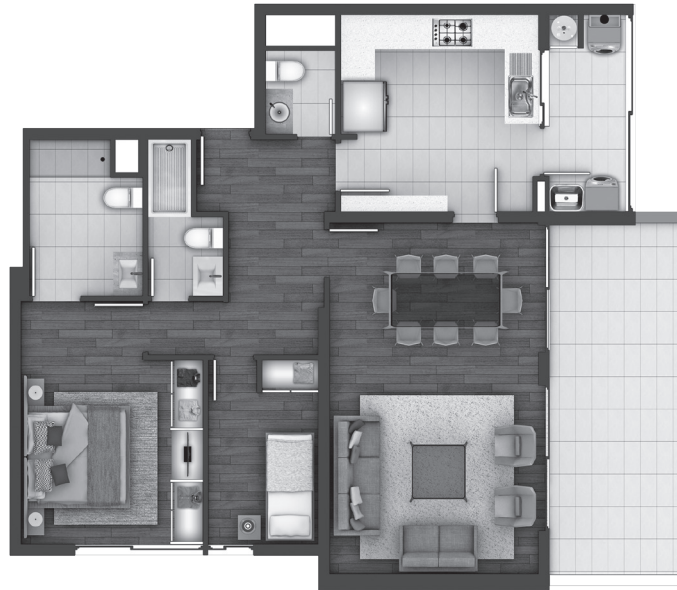
Planta Piso Tipo 1°